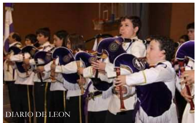
DIARIO DE LEON

La banda de cornetas, tambores y gaitas de la Real Hermandad participó en el concierto solidario en beneficio de los damnificados por el terremoto de Haití bajo el título 'Cofrades de León por Haití', y que se celebró el pasado 31 de enero en el pabellón 'La Torre' de León. La iniciativa, organizada por las bandas del Santo Cristo de la Victoria y de Minerva y Veracruz, logró recaudar más de 6.000 euros.