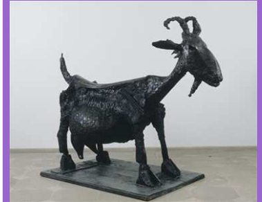
La Cabra. Pablo Ruiz Picasso, 1950.

Dominó todas las técnicas, tallas, materiales y conceptos. Fue la tristeza hierática de La Soledad, pero también el movimiento extremo y la liviandad del Resucitado. Renunció al silogismo " innovo luego arte soy " para convertirse en el Fernán Gómez de la escultura: un artista integral que dominó la imagen como sus propias manos.